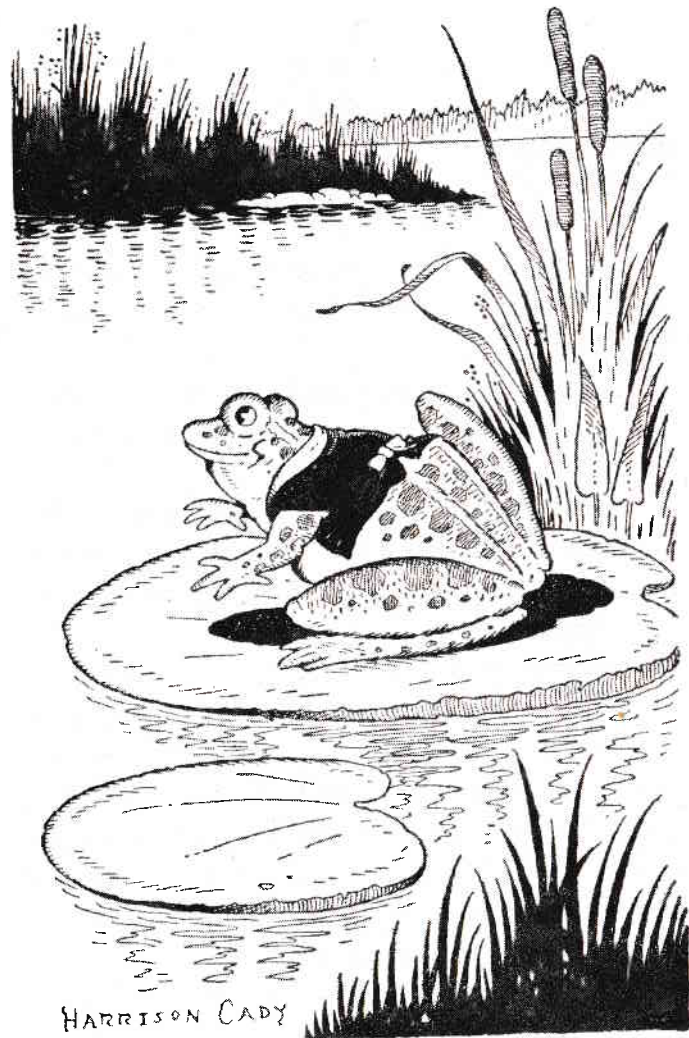
Taica Oac își netezi tacticos vestuța alb-gălbuie și luă fața de bătrân înțelept.

Taica Oac deschise gura și prinse din zbor prostomusca verde pe care Brizuțele i-o mânaseră